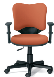
KD-A93SKL アジャスト肘 テラコッタオレンジ