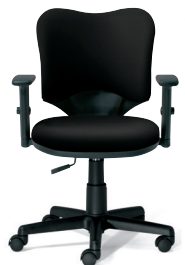
KD-A93SKL アジャスト肘 ブラック