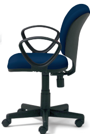
KB-A93SKL ループ肘 ネイビー