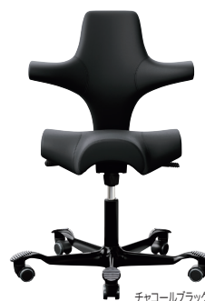
チャコールブラック