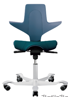
ブルーベリーブルー