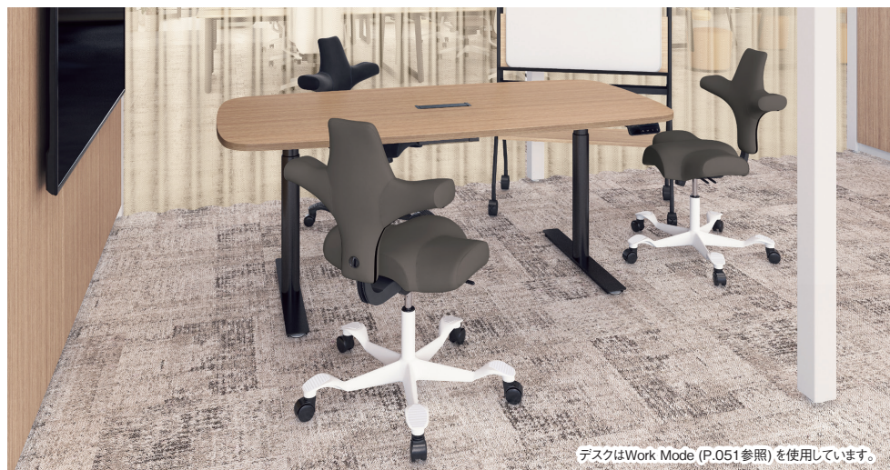
デスクはWork Mode (P.051参照)を使用しています。

ユニークなチェア形状で、前向き、後ろ向き、横向き、足をあげてリラックスしたり、回転したり、使用する人の自由な座り方を支えます。