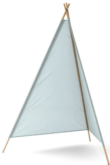
ターコイズブルー