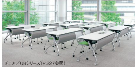
チェア / UBシリーズ (P.227参照)