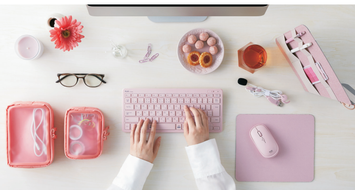
※マウスパッドは参考商品です。