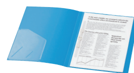
書類や名刺の一時保管に便利な内ポケット付。