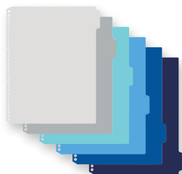
クールトーンライン