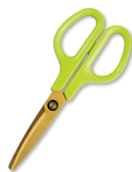
② アップルグリーン