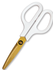
④ マッシュルームホワイト