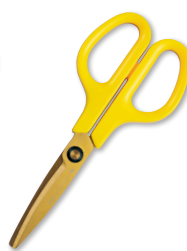
③ バブリカイエロー