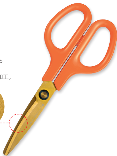
① キャロットオレンジ