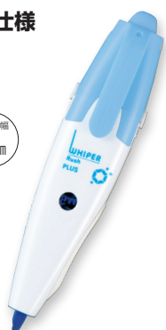
① ホワイト/ライトブルー