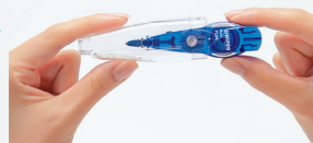
交換テープを入れ替える