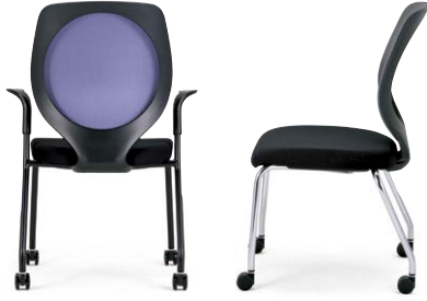
MB-3537006BMS-UC 肘付 / バイオレット