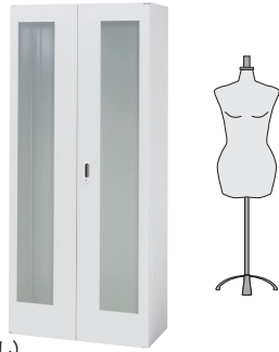
ガラス両開き 保管庫 (棚板なし)