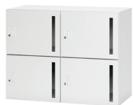
① NL-B70-4LS W4

高さ700mm [L6との組合せ] 上下連結可能 スペーサーの使用により横連結可能