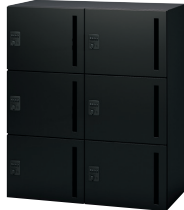
⑤ NL-B105-6LD SBK