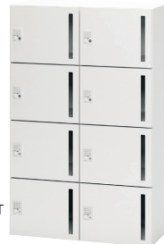
⑨ NL-B140-8LT W4

※使用の際、ベースとの組合せは必須となりますので必ずセットでお買い求めください。