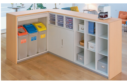
※この写真は内向きレイアウトです。