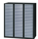
クリアケースキャビネット