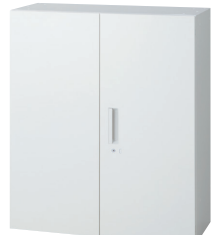
スタンダードタイプ (W4) →P.401～