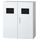
ダストボックスユニット