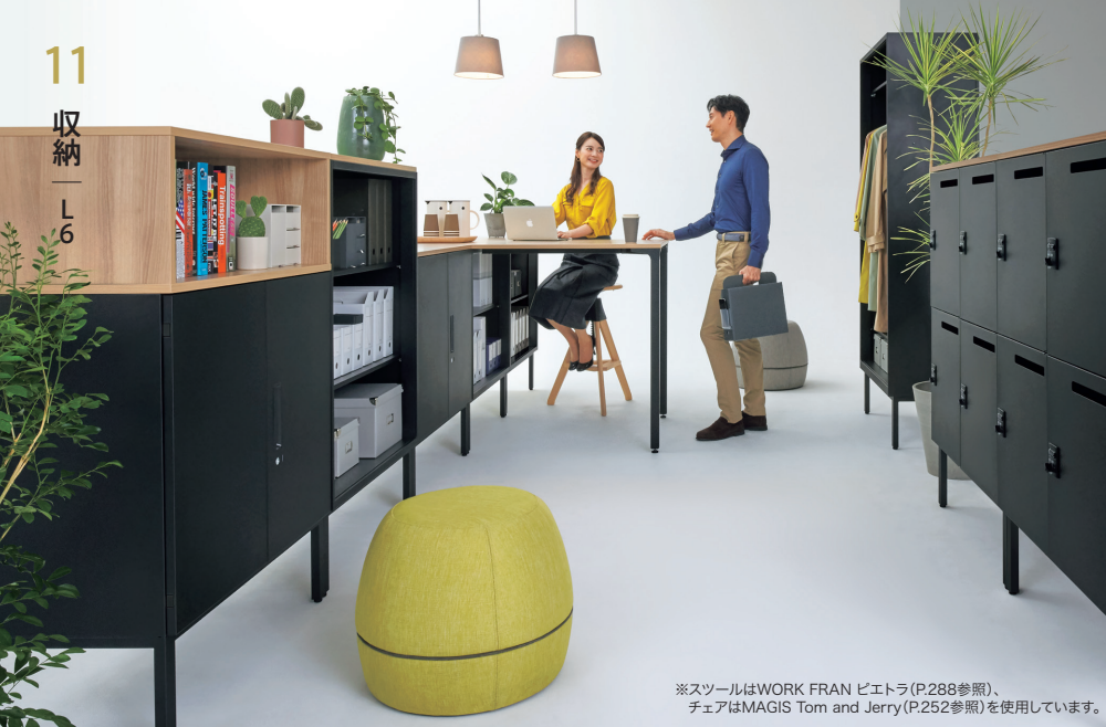
※ツールはWORK FRAN ビエトラ(P.288参照)、 チェアはMAGIS Tom and Jerry(P.252参照)を使用しています。