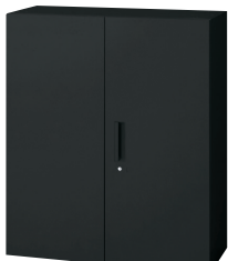
ブラックタイプ (SBK) →P.397～

ハイバースとの組み合わせに、全8種の収納ユニットを推奨します。 P.396の〈セレクト推奨ユニットリスト・レイアウト時のご注意〉とあわせてご検討ください。