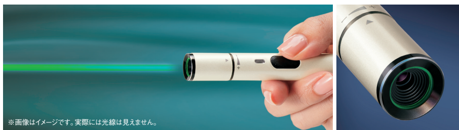
※画像はイメージです。実際には光線は見えません。

上質な光沢を放つペン型のボディや、ダイヤカットを施した照射部周りなど、従来のレーザーポインターとは一線を画したデザイン。高級文具のような「持つ喜び」を感じさせるラインアップです。