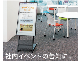
社内イベントの告知に。

重厚感よりもディスプレイを引き立てるシンプルさを追求しつつ、カジュアルになりすぎず、オフィスやビルのエントランスにも溶け込むスタイリッシュなデザインを目指しました。キャスター付なので移動も簡単です。