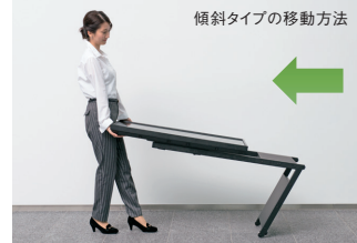
傾斜タイプの移動方法

キャスター付で移動がラク。 台座の後側のキャスターで、移動がスムーズ。本体を後側に倒しながら、少ない力で簡単に動かすことができます。