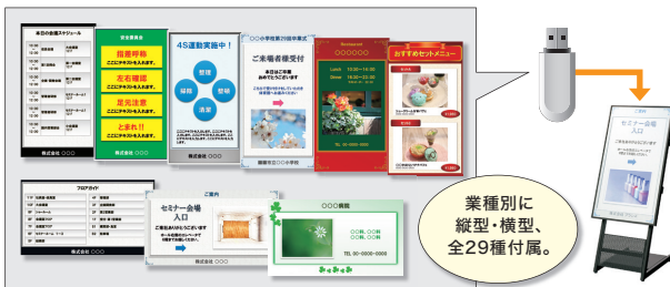
業種別に縦型・横型、全29種付属。

オフィス・飲食・服飾・工場など、業種別のテンプレートが付いているので、どなたでも簡単にコンテンツの作成ができます。