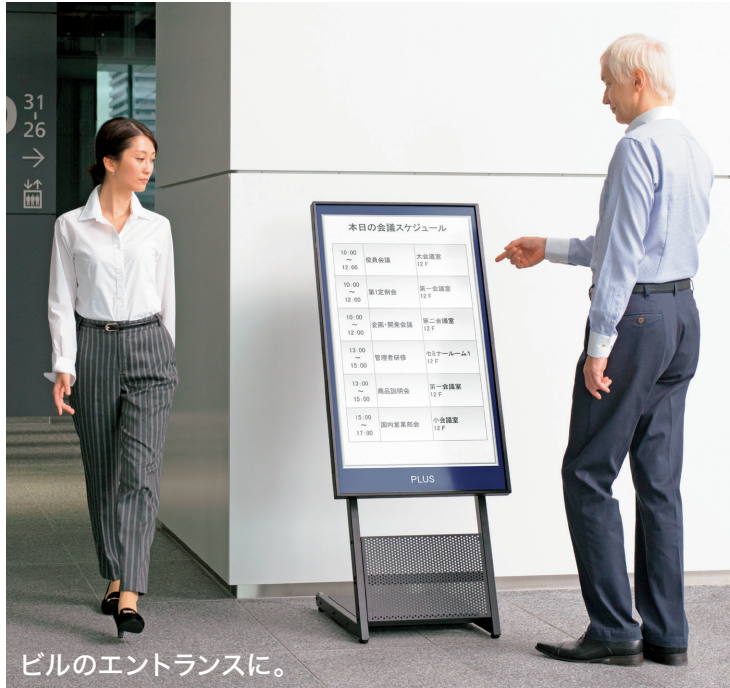
ビルのエントランスに。

パソコン不要、USBメモリひとつで再生。テンプレート付きで今すぐ導入できるスタンドアロン型デジタルサイネージ。