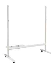
スタンド+プリンタトレイ