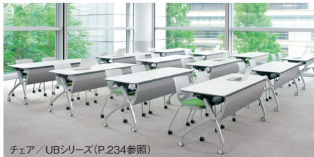
チェア / UBシリーズ (P.234参照)