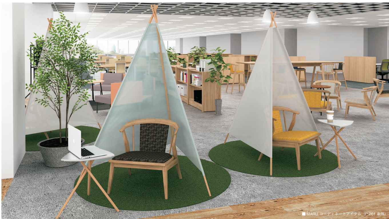
MARU コーディネートアイテム (P.261 参照)