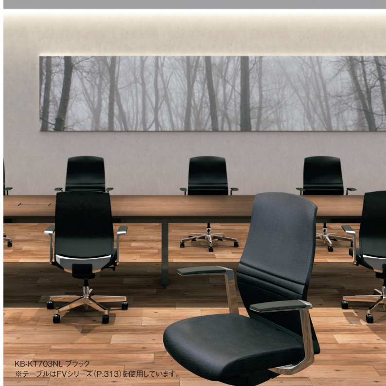
KB-KT703NL ブラック ※テーブルはFVシリーズ(P.313)を使用しています。