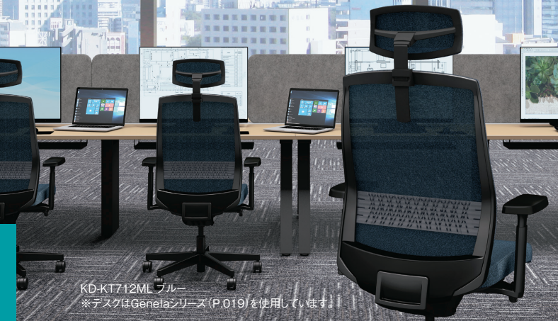
KD-KT712ML ブルー ※デスクはGenelaシリーズ(P.019)を使用しています。