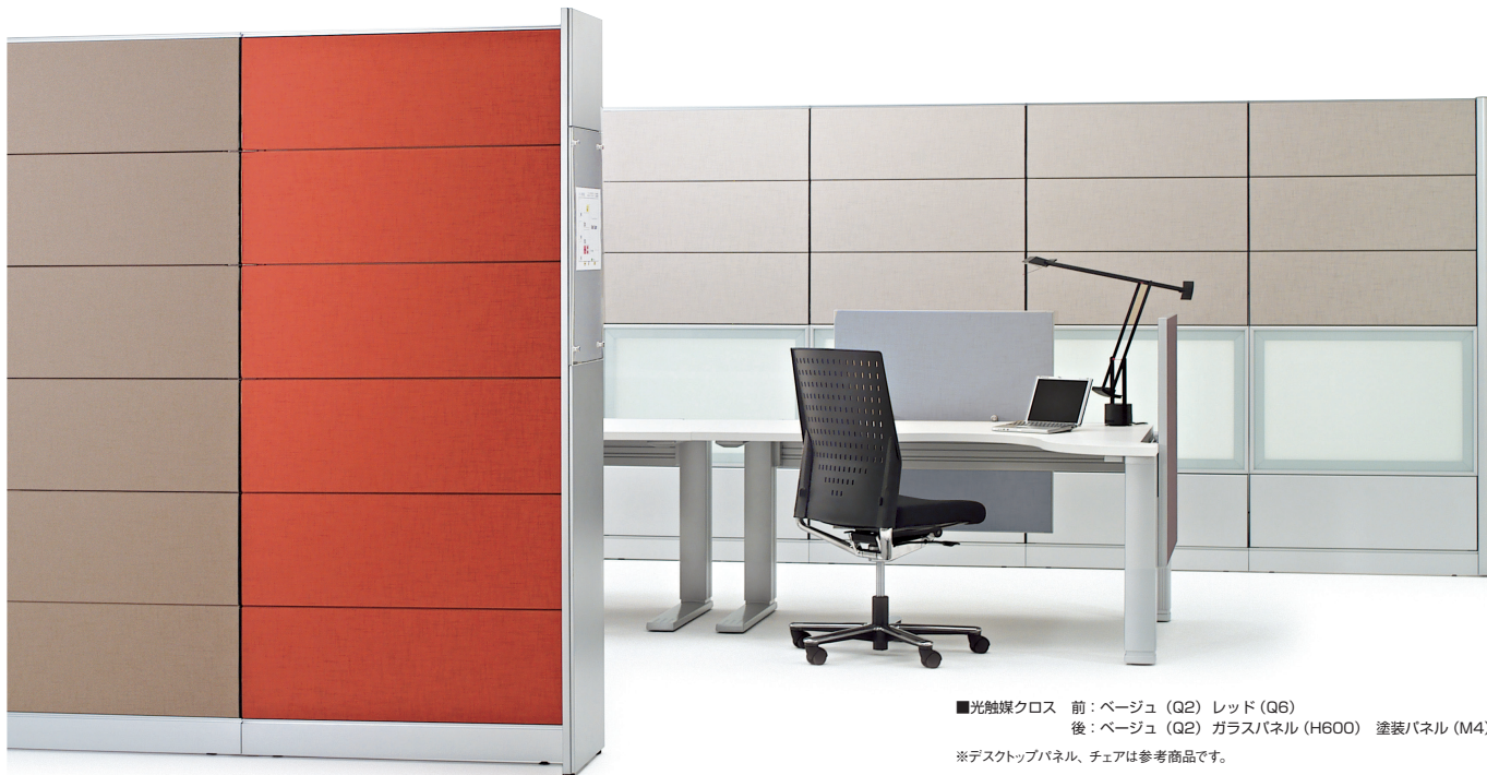
■光触媒クロス 前：ベージュ (Q2) レッド (Q6) 後：ベージュ (Q2) ガラスパネル (H600) 塗装パネル (M4) ※デスクトップパネル、チェアは参考商品です。

LFシリーズの特長は、そのフレキシブルな組合せシステムにあります。パネルモジュールは高さ4種類・幅8種類。クロスカラーは多彩な16色をラインアップ。パネル素材も光触媒クロスをはじめ、ガラスパネルなどから自由にセレクトできます。