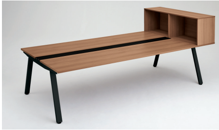
GE-N2414KS4 T2 / SBK 収納内向き装着時