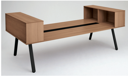
GE-N2414WS4 T2 / SBK 収納内向き装着時